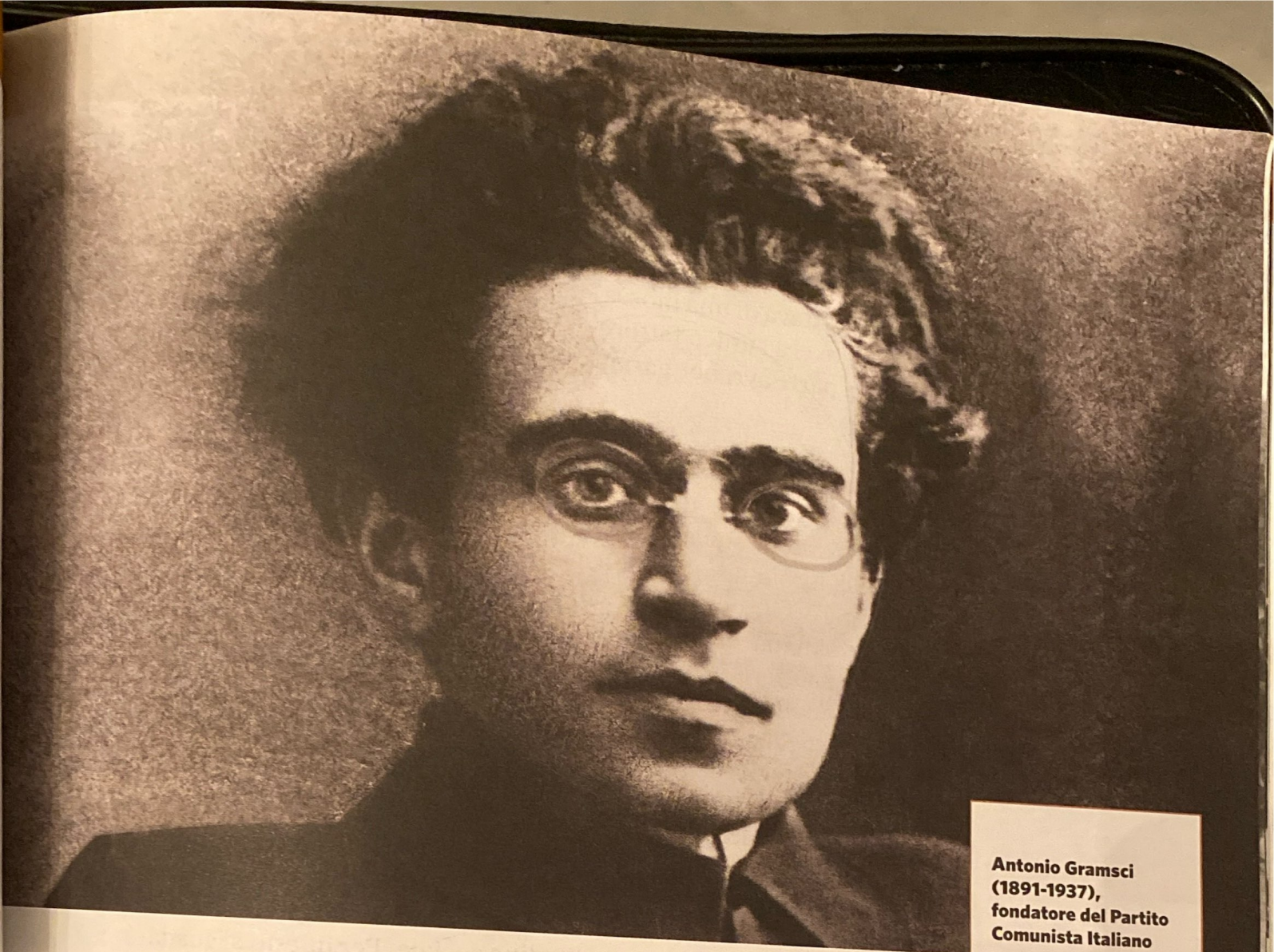
Antonio Gramsci (1891-1937), fondatore del Partito Comunista Italiano

meno vicino alla popolazione) e proponevano riforme sociali avanzate, come la giornata lavorativa di otto ore e il voto alle donne. Oltre a questo (che non si differenziava molto dalle idee dei socialisti massimalisti), Mussolini faceva però leva sull'ideale nazionalistico. Questa si rivelò essere la sua mossa più efficace, poiché in tal modo riuscì a unire le richieste dei socialisti con quelle dei reduci, due categorie decisamente rivali tra loro. Non a caso il simbolo da lui scelto per rappresentare il suo movimento, il fascio littorio , richiamava non solo i fasti dell'antica Roma (a cui i fascisti si ispireranno poi esplicitamente) ma anche quell'unità che la popolazione italiana non era mai riuscita a raggiungere pienamente (il fascio è infatti composto da bastoni tenuti insieme da un laccio di cuoio).