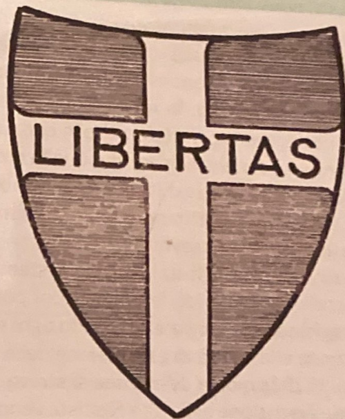
Uno dei primi stemmi del Partito Popolare

Con questo partito, che ebbe subito grande successo anche sul piano elettorale, finalmente i cattolici si riavvicinarono alla vita politica italiana, dopo il duro periodo che aveva fatto seguito alla presa di Roma e al successivo non expedit promulgato dal papa in quell'occasione.