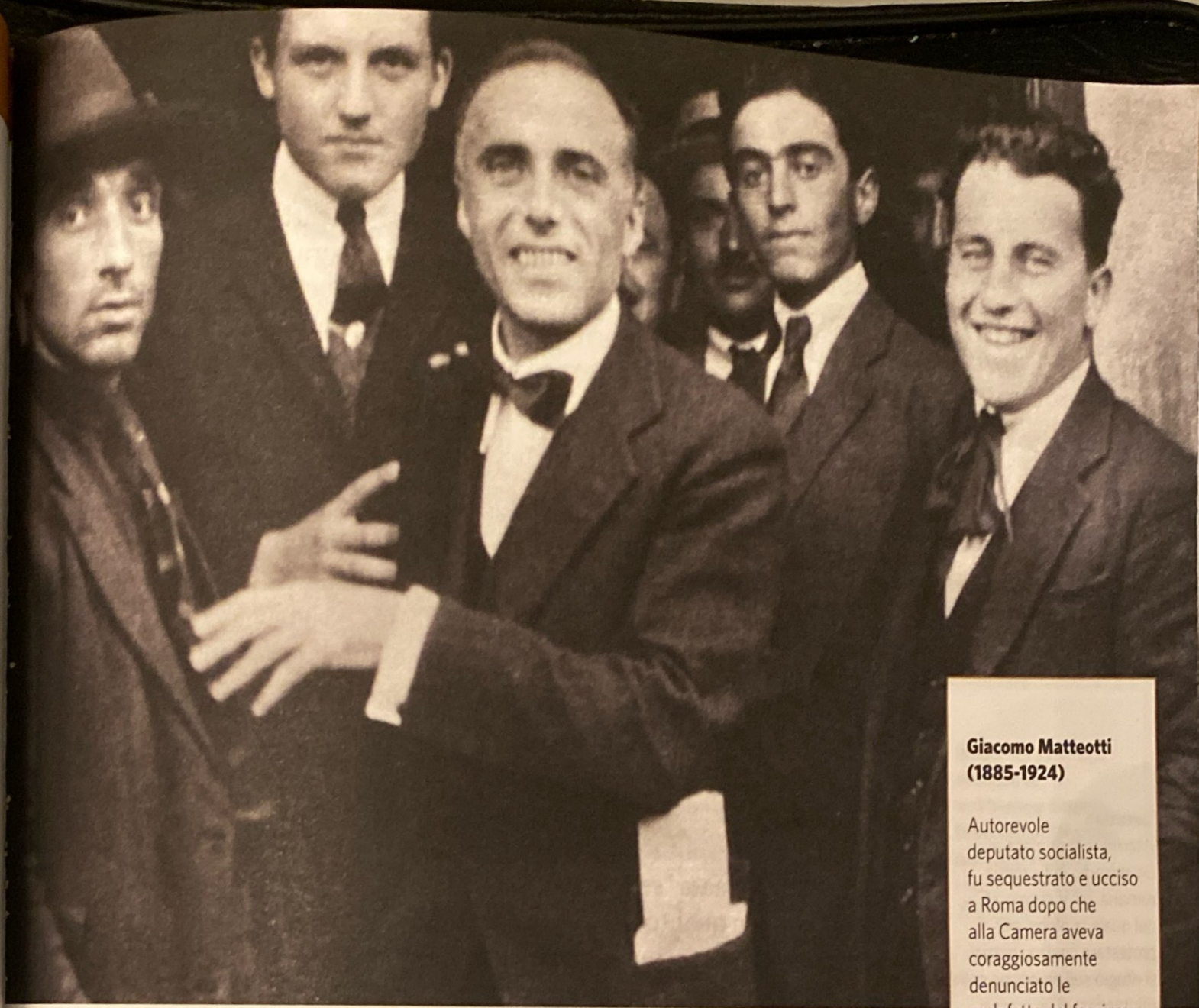
Giacomo Matteotti (1885-1924)

Autorevole deputato socialista, fu sequestrato e ucciso a Roma dopo che alla Camera aveva coraggiosamente denunciato le malefatte del fascismo.