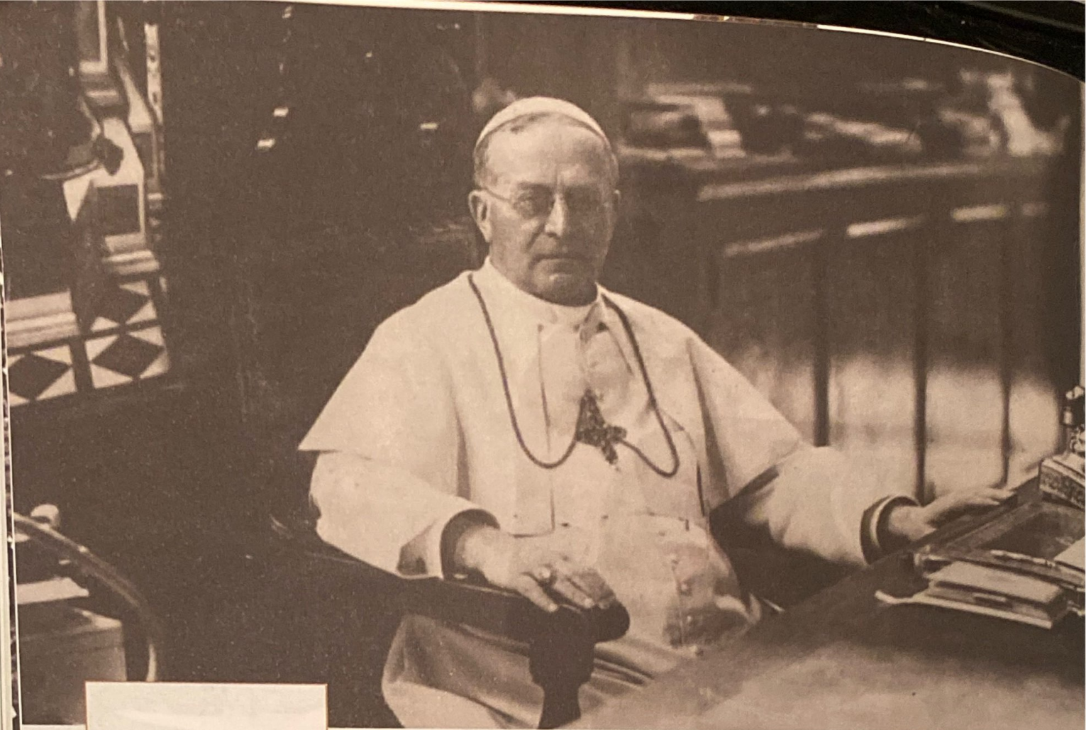
Pio XI al suo tavolo di lavoro in Vaticano