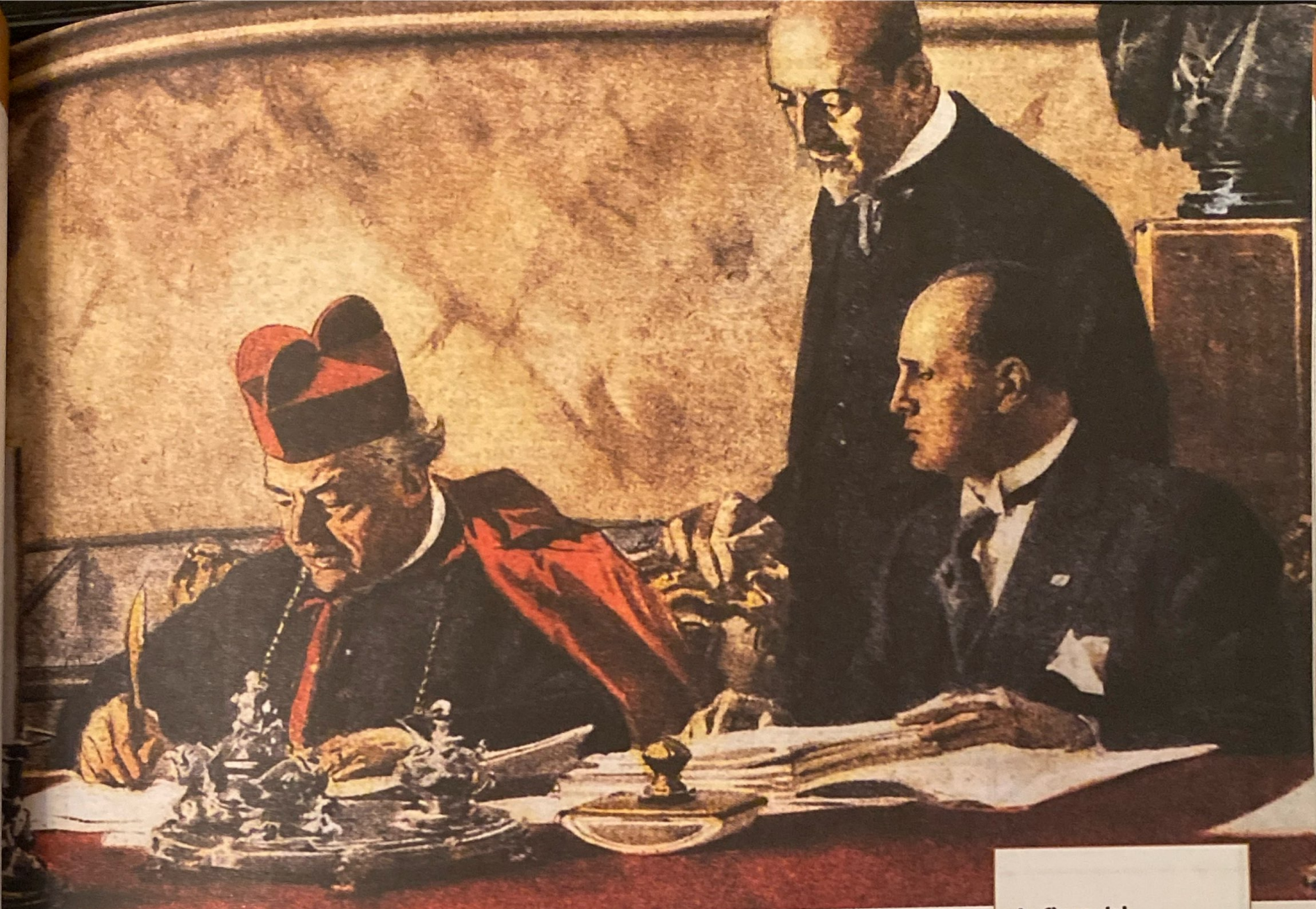
La firma dei Patti Lateranensi, 11 febbraio 1929

Illustrazione di Achille Beltrame tratta da La Domenica del Corriere , 24 febbraio 1929.