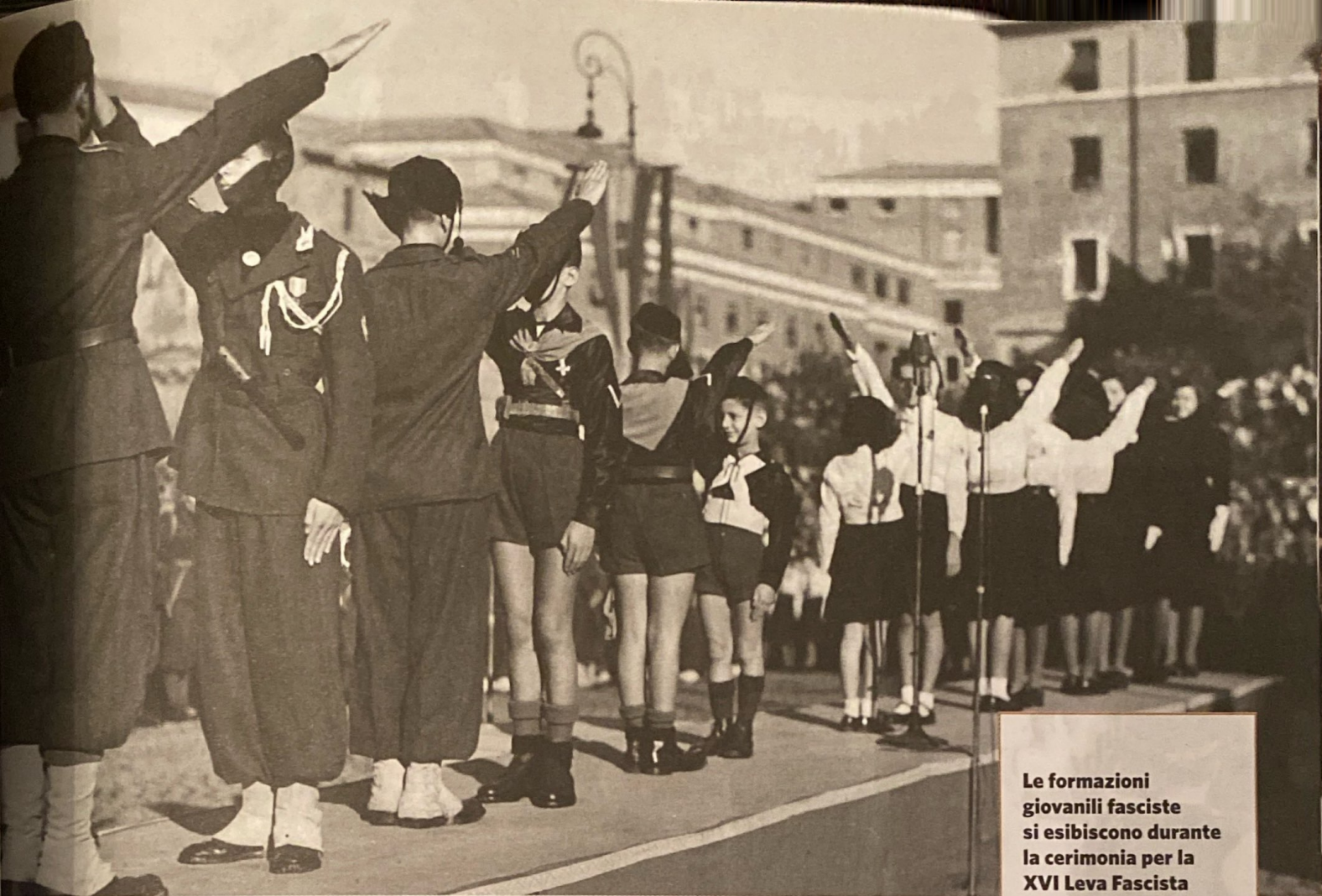
Le formazioni giovanili fasciste si esibiscono durante la cerimonia per la XVI Leva Fascista Roma, 1 ottobre 1942

stato spinse i braccianti bisognosi di lavorare a recarsi in queste zone da ogni parte d'Italia. Sulle terre bonificate vennero fondate nuove città come Sabaudia, Aprilia e Littoria (oggi Latina) ma i risultati complessivi di tali iniziative non furono così positivi come il regime volle far credere; stessa cosa per la battaglia del grano: senza dubbio vi fu una crescita nella produzione ma non al livello sbandierato dalla propaganda).