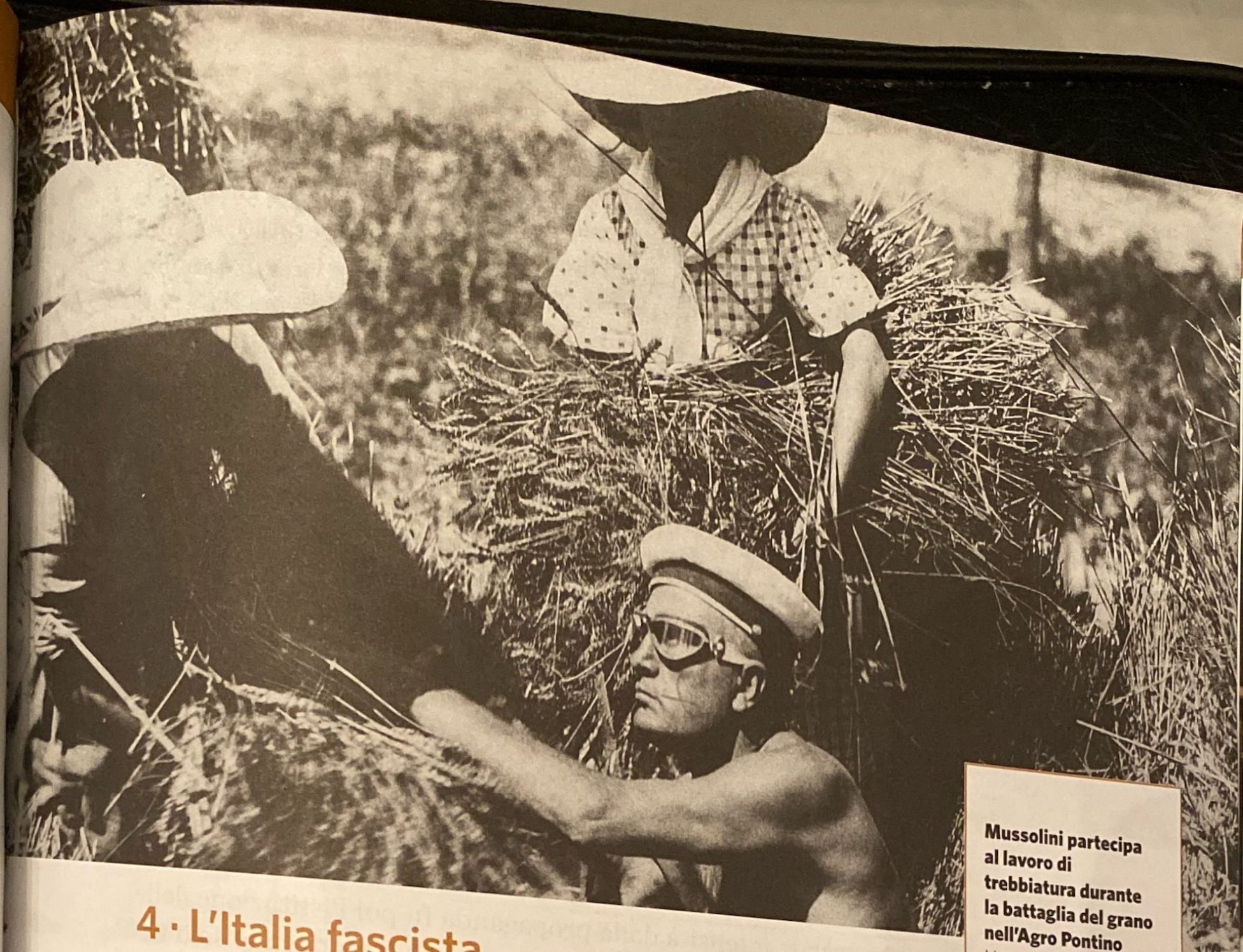
Mussolini partecipa al lavoro di trebbiatura durante la battaglia del grano nell'Agro Pontino Littoria (oggi Latina), 27 giugno 1935